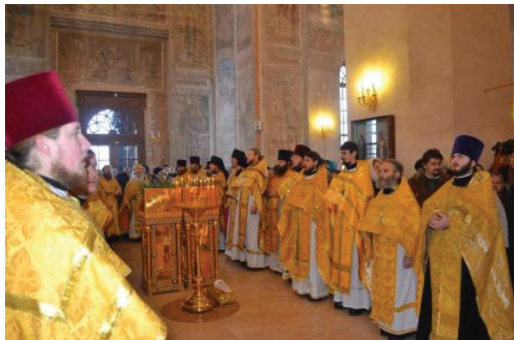
Праздничная Божественная литургия

23 января Святая Православная Церковь отмечала день памяти святителя Феофана, Затворника Вышенского. Это празднование установлено в 1988 году, когда святитель был прославлен на общецерковном уровне.